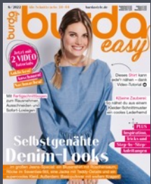
burda easy 6x / Jahr