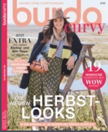
burda curvy 4x / Jahr