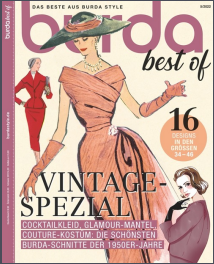
burda best of 5x / Jahr