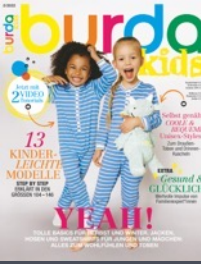
burda kids 2x / Jahr