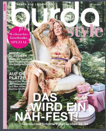
burda style monatlich