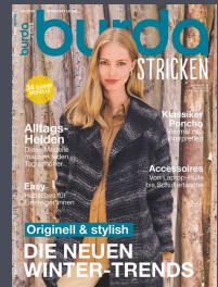
burda stricken 6x / Jahr