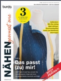
Nähen, gewusst wie 2x / Jahr